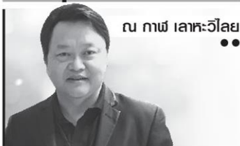
ณ นภาพ เลลาเยวาลัย