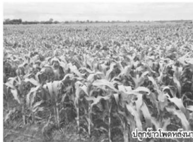
ปลูกข้าวโพดหลังนา

เชิญชวนปลูกพืชอื่นๆ แทนการทำนาปรัง เข้าประชุมชี้แจงที่ประชุมกำนันผู้ใหญ่บ้าน ภายในเดือนตุลาคม 2561 2.ให้ชี้แจงเกษตรกรในพื้นที่ที่ทราบด้วยว่าเกษตรกร/ชาวนาที่เข้าร่วมโครงการจะได้สิทธิในการกู้เงินจากธ.ก.ส. มากเป็นเงินทุนสินเชื่อดอกเบี้ยต่ำในอัตราร้อยละ 0.01 มีสิทธิกู้ไร่ละ 2,000 บาท ไม่เกิน 15 ไร่ และรัฐบาลทำประกันภัยพืชผลเพื่อลดความเสี่ยงด้านภัยพิบัติเพิ่มเติมจากเงินชดเชย สาธารณภัยตามระเบียบกระทรวงการคลัง อีกไร่ละ 1,500 บาท โดย